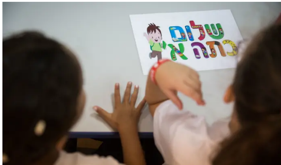
חזרה ללימודים, תלמידים, למצולמים אין קשר לכתבה

תחת הערך "שוויון" במילון אבן-שושן, מופיעה ההגדרה: "דמיון גמור, היעדר כל הבדל". בחינה מקרוב של מערכת החינוך הישראלית מעלה שיש בה כמעט הכל, פרט לשוויון. היום (ראשון) יתקיים בסמינר הקיבוצים הכנס "חינוך עם אנ'דה של צדק חברתי" של עמותת קדמה לשוויון בחינוך. בכנס, המיועד לאנשי חינוך ולכל מי שמבקש לרכוש כלים מעשיים להוראה ודיון בנושא אי-שוויון בבתי ספר, תושק "מי למעלה? מי למטה?", חוברת חדשה של "קדמה" הכוללת 30 מערכי שיעור וניתוח ביקורתי של המציאות החברתית-כלכלית.